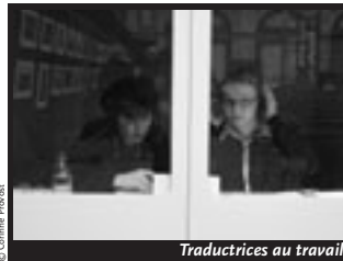
Traductrices au travail.

Les interprètes-traducteur-trices de Babels, www.babels.org