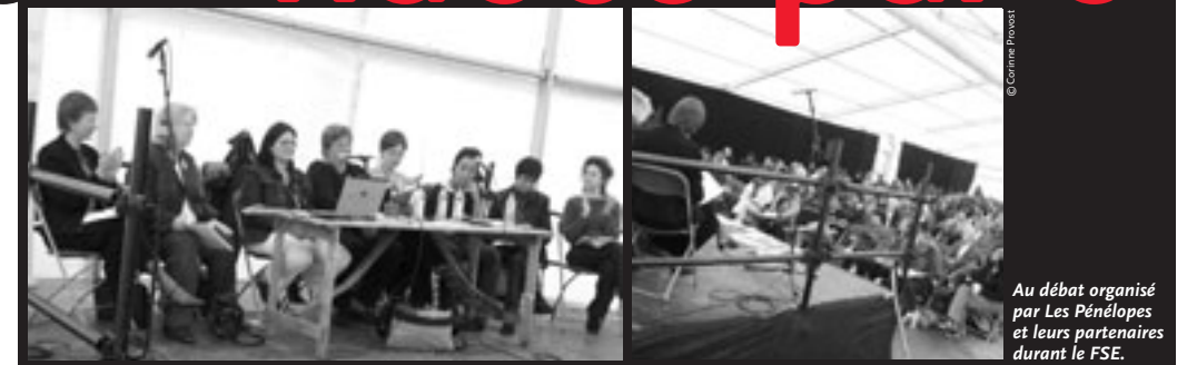
Au débat organisé par Les Pénélopes et leurs partenaires durant le FSE.