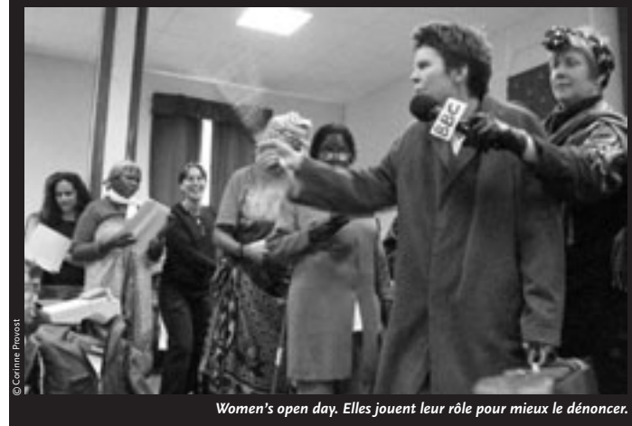
Women's open day. Elles jouent leur rôle pour mieux le dénoncer.

COMMUNICATION Liberté d'expression | par ANNE MARCHAND | LES PÉNÉLOPES