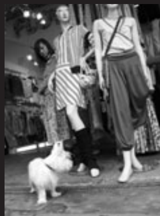
Camden Town market, a popular meeting place on Sundays.