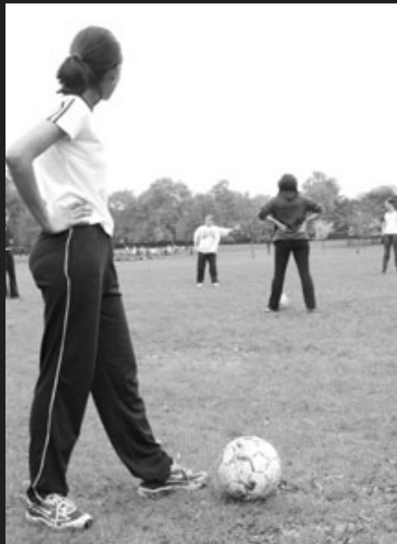
Le football libère-t-il les jeunes filles? Does football set girls free?