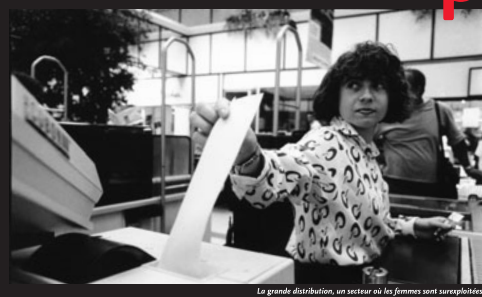
La grande distribution, un secteur où les femmes sont surexploitées.