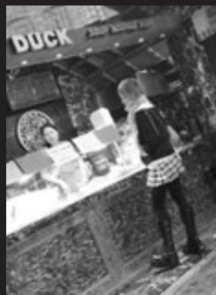
Le marché de Camden Town, un rendez-vous dominical populaire.