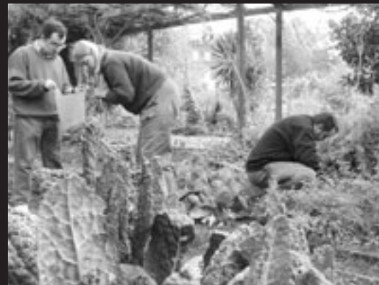
Le jardin communautaire Culpeper, cultivé par et pour les habitants du quartier.