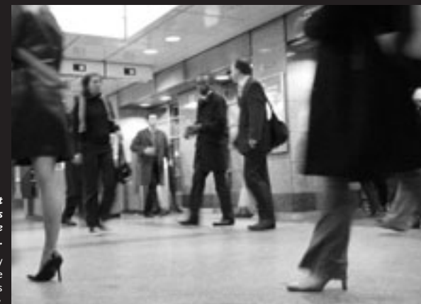
Running – a daily sport for some inhabitants of this giant city.