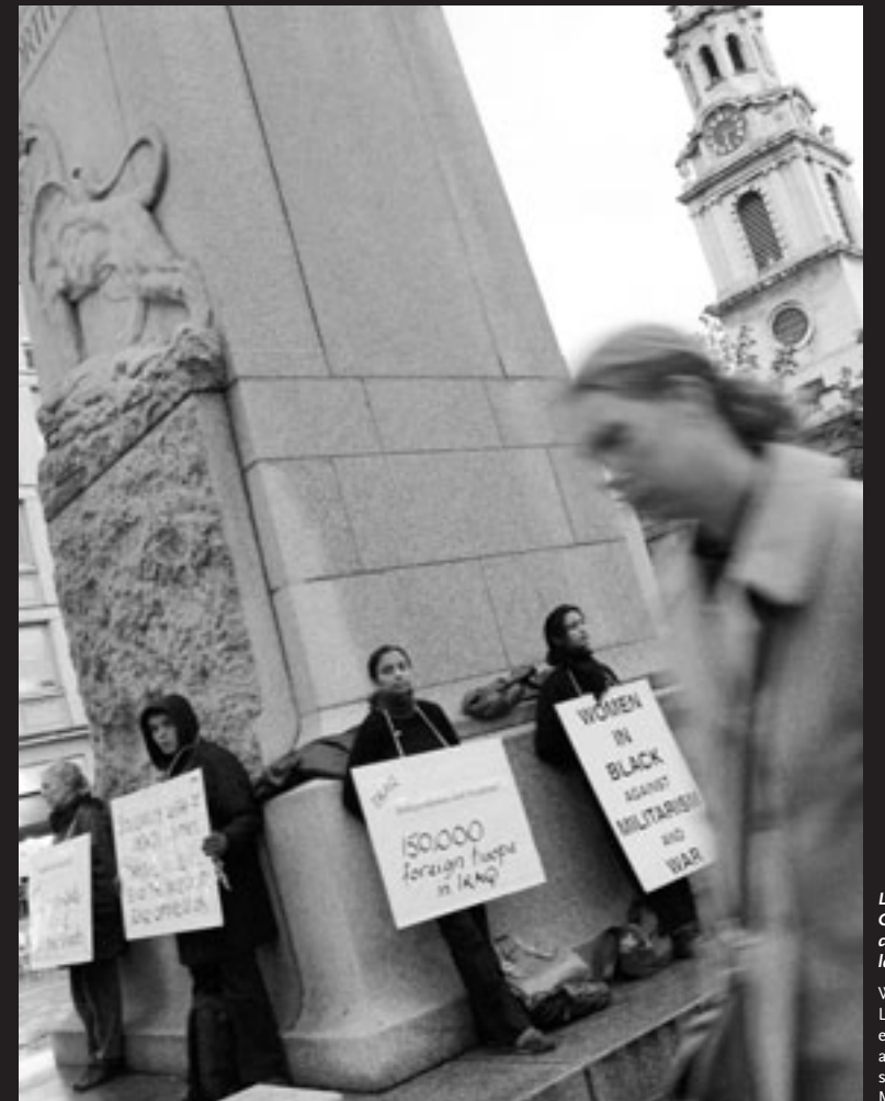
Les Femmes en noir G-B, réunies comme chaque mercredi sur la place Saint-Martin.