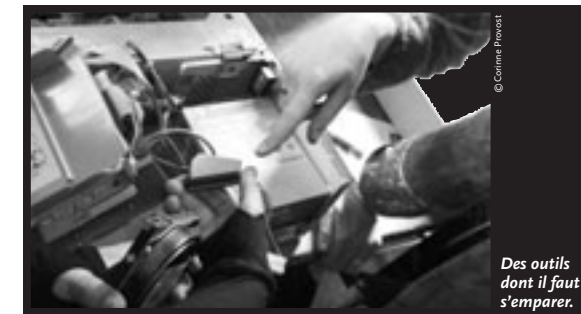
Des outils dont il faut s'emparer.