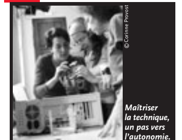
Maîtriser la technique, un pas vers l'autonomie.