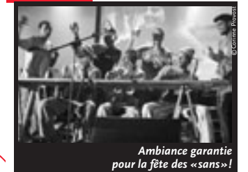
Ambiance garantie pour la fête des «sans»!

LA MARGE , c'est leur territoire, au quotidien: en marge du marché du travail, de l'accès au logement, aux soins, à l'éducation, aux papiers... aux droits tout simplement. Et c'est en marge des lieux officiels que les No Vox ( www.novox.ras.eu.org ) et autres «sans» ont établi leur campement. Et dans la rue qu'ils ont voulu se faire entendre. Parce que la précarité se combat «dans l'action, pas seulement dans la discussion», ils se sont retrouvés dans des «actions-transports» et des «action-mac-do». Mais pour beaucoup, Calais fut le bout du voyage. Sur la construction de l'Europe, les Sans n'entendent pas se taire. En savoir plus : www.euromaday.org