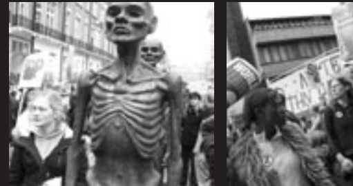
A la manif qui clôturait le FSE.