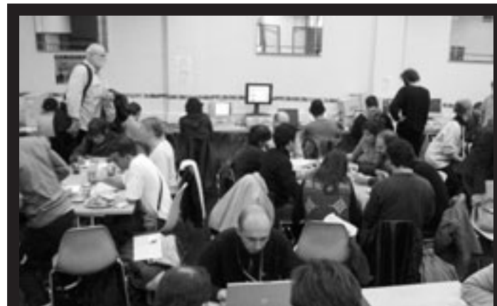
Le Camden Center métamorphosé en cybercafé pour médias activistes.